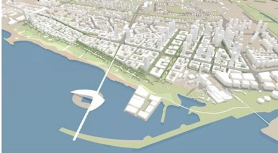
הדמיית פרויקט פינני שדה דב

בשנת 2008, במסגרת מימוש האחריות של שר התחבורה בנושא, השר שאול מופז מינה את ועדת בודינגר, שתפקידה היה לייצר את החזון. ועדה בין-משרדית, שישבה ובחנה את הנושא מקצה לקצה, הגדירה חזון ובחנה איך נכון לממשו. ועדת בודינגר הסתכלה על מפת התעופה בישראל, הפנים ארצית והבין-לאומית, בראיית 2030. ככה בונים חזון. אלוף במילואים הרצל בודינגר, מפקד חיל האוויר לשעבר, הציג את הדוח לממשלה, שאישרה את ההמלצות עד האחרונה שבהן. מי מהשרים של היום קרא את הדוח? אם חושבים שוועדת בודינגר לא עשתה את עבודתה נאמנה, שימנו ועדה משלהם, ינחו אותה להנחות יסוד אחרות מאלה שוועדת בודינגר בחנה את התעופה על פיהן וימתינו להמלצותיה.