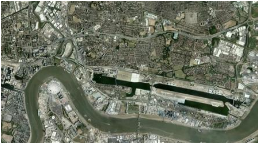
שדה התעופה בלונדון. עבר שיפוץ לאחרונה

דבר אחד ברור לכל מי שעוסק בתחום - להרוס שדה פעיל זה קל, קל מאוד. למצוא לו תחליף, בעיקר אם השדה אינו מוגדר בתוכנית המתאר הארצית כשדה או מנחת, זה על גבול הבלתי אפשרי. כל בר דעת מבין ששדה התעופה דב ושדה התעופה הרצליה הינם "אבן הראשה" של התעופה הפנים ארצית של ישראל. זו אינה פראזה, אחרי הסגירה יישארו לתעופה הפנים-ארצית בצפון את השדות בראש פינה ובחיפה, באחריות רשות שדות התעופה, ומנחת במגידו. במרכז לא יישאר כלום! כן, אני יודע שמחפשים תחליף להרצליה בעין שמר, אלא שמערכת הביטחון מחפשת שיזיזו לה את המתקן הביטחוני ממנו (כן, גם את עין שמר הפכו משדה תעופה שטסו בו גם אזרחים, לקרקע למתחם ביטחוני שאינו דורש מסלול טיסה). בחלק הדרומי של ישראל יש את מנחת שדה תימן ושדה התעופה באילת.