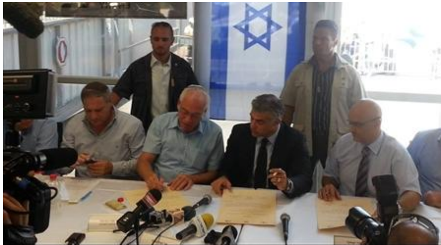
צילום: פייסבוק אורי אריאל לפיד ואריאל חותמים על פינוי שדה דב. למה כל הנדל"ניסטים רצים לשם?

שר הבינוי והשיכון הבטיח דירות במחיר שווה לכל נפש לזוגות צעירים. נו, באמת - במחירי הדירות ברחוב ליד, מה שאמורה להיות שכונת הצעירים של תל אביב אפילו ידי אינה משגת, אז זוגות צעירים? כל הנדל"ניסטים רצים לשם, כי זה יהיה שיכון לצעירים? אז אולי שווה להגיד כמה מילים על החזון של מדינת ישראל בנושא התעופה, או ה"אין חזון", כי כל מה שקורה הוא מדרון חלקלק ללא שום חזון ותכנון.