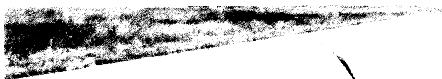
סימני הבלימה/החלקה של צמיגי המטוס