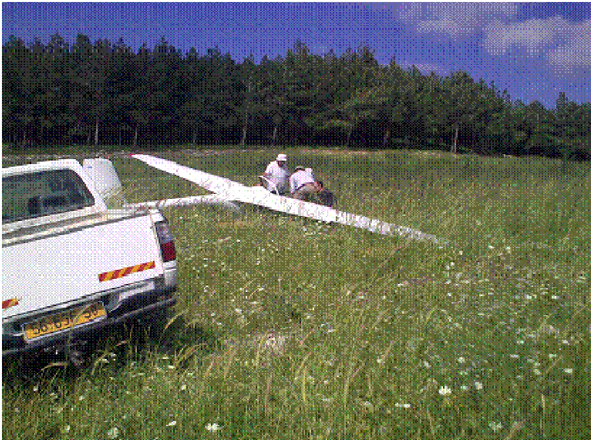
הדאון נשוא התאונה בשטח הנחיתה

במהלך דאייה מחוץ ל"משפך המסלולים" של מנחת מגידו, לא הצליח הדואה להשיג פוטנציאל ולחזור חזרה למנחת והוא נאלץ לבצע נחיתה בקרחת חורש באזור גבעי. הדואה נחלץ ללא פגע, אך לדאון נגרם נזק.