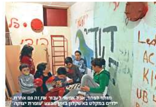
חומר למחך, אבל אפשר לעבור את זה גם אחרת. ילדים במקום באשקלון בזמן מבצע 'עומרת יצוקה'

"די הוחמאתי מהמומחה שכתב שחשוב שהספר יהיה בארון הספרים של גן הילדים ככלי עזרה ראשונה לשעת חידום. לדעתי הספר מתאים לא רק לעת מלחמה. אפשר ממנו להקיש גם למצבי לחץ אחרים. יש ילדים שפוחדים למשל מויקוקין דינו, או מברקים ומדעמים, ובעזרת הספר הם יכולים להידגע בציק"