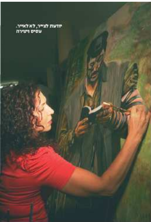
ידועת לציור, לא לאייר. עסיס וציירה