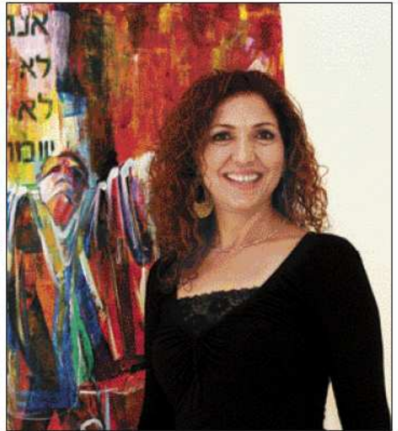
בזמנה רותי עסיס

תמיד אמרים שהאמנות יוצאת מתוך כאב גדול ואני חושבת ההפך. אפשר ליצור מתוך שמחת חיים, מתוך אושר פנימי גדול. רותי עסיס