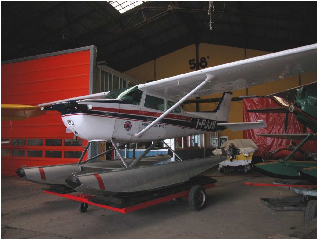
ואחד כבר כמעט במים