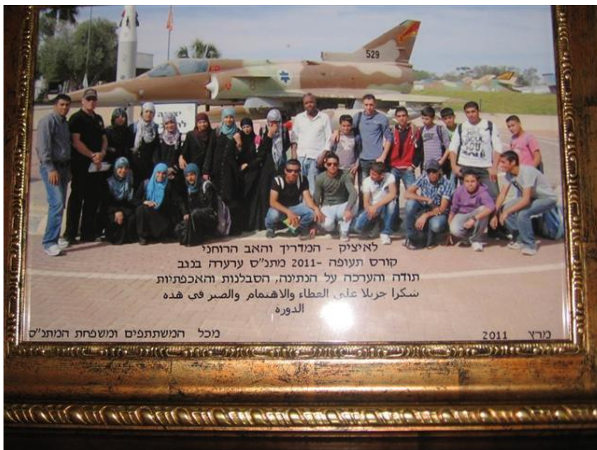
המזכרת מחניכי החוג