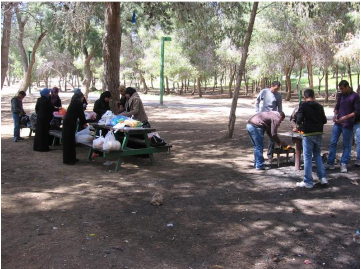
והבנים אחראים על האש