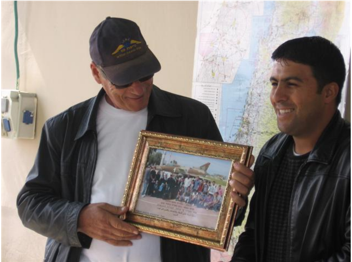
מזכרת מחניכי החוג למדריך