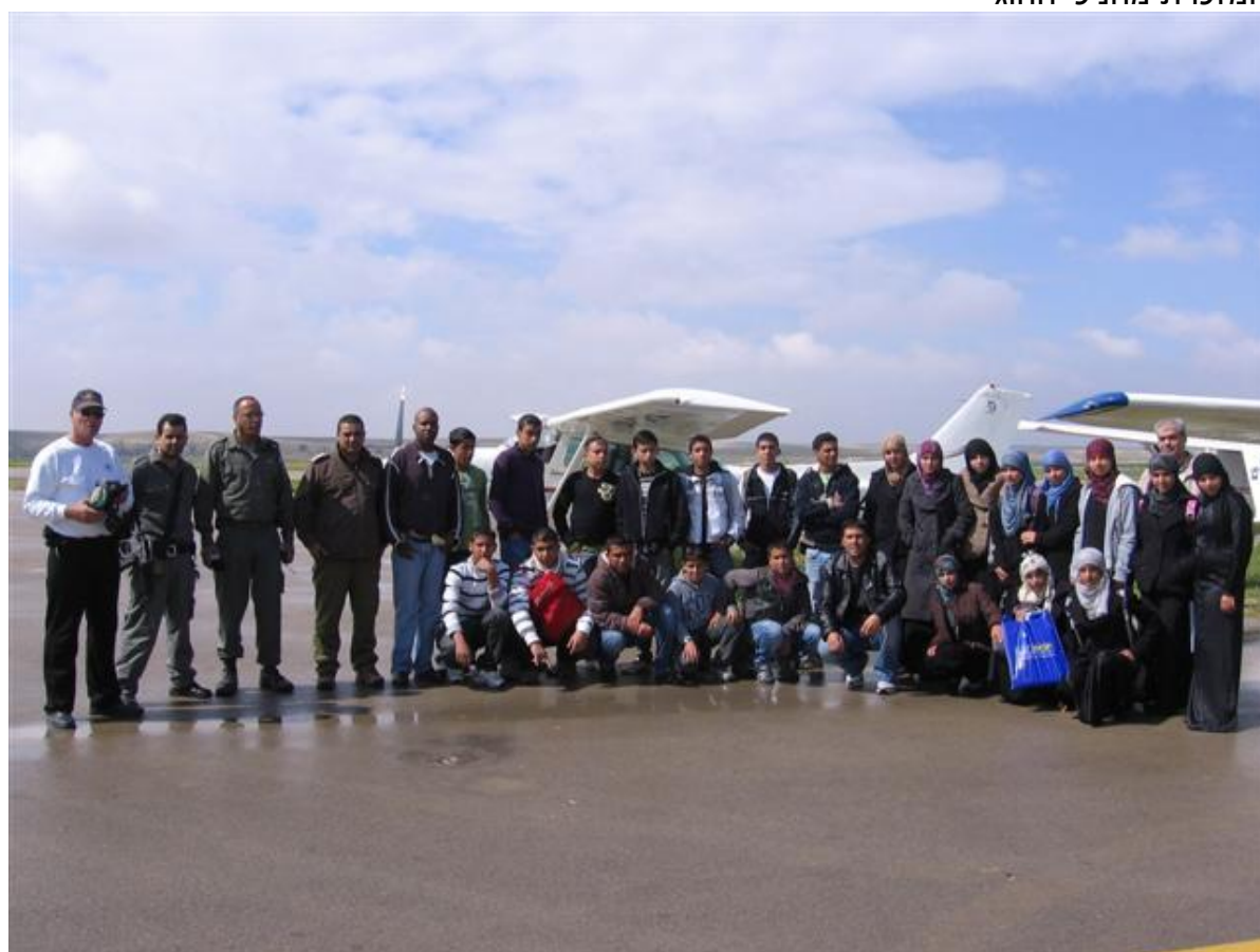
תמונה קבוצתית בשדה תימן

ולסיום החוג חפלה בדואית על האש בפארק אופקים.