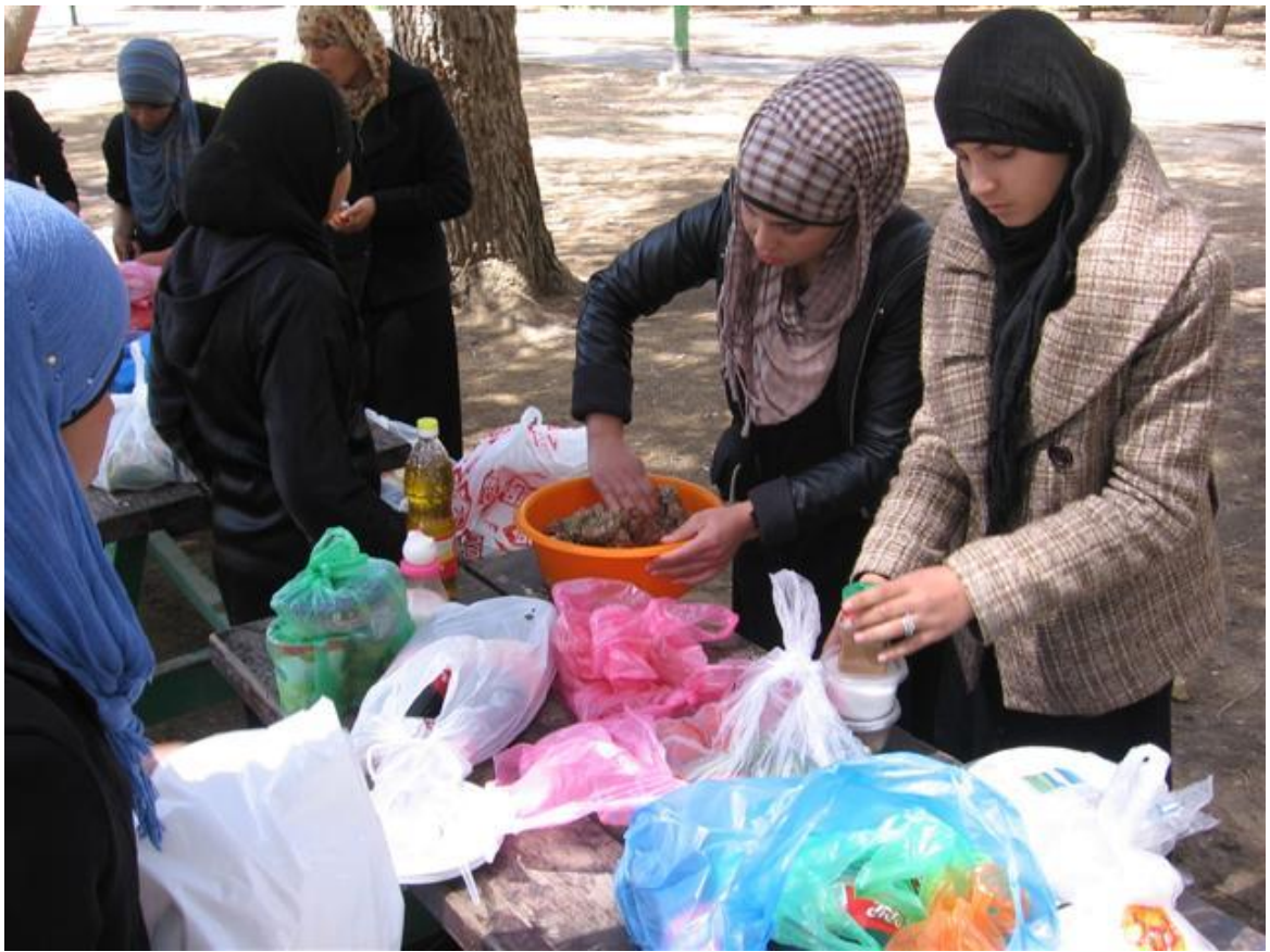
הבנות מכינות את הסלטים והבשר