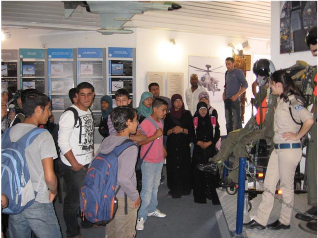
הסברים מפי המדריכה במוזיאון

המפגש השביעי כלל סיור במוזיאון חיל האוויר שבו קיבלו התלמידים הסברים על כל המוצגים מפי מדריכה חיילת חיל האוויר.