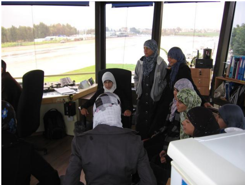
מקבלים הסברים במגדל הפיקוח

החוג נפתח בתחילה עם מספר משתתפים קטן של 15 בנות ובנים מכיתות ט' י' אולם במפגש השני כבר עלה מספרם ל 24 שהוריהם אגב, משלמים עבור השתתפות ילדיהם בחוג סכום סמלי של 50 ₪ למתנ"ס. נערכו חמישה מפגשים שבועיים של שעתיים לכל מפגש בהם הועברו לתלמידים שיעורים בעזרת מצגות בנושאי תעופה החל מתולדות התעופה, אירונאוטיקה העשרה בתעופה, מטאורלוגיה נוהל הקפה נוהלי קשר ניווט ובקרה, כאשר בסיום כל שיעור נערך לתלמידים בוחן בכתב על הנושאים שנלמדו. הענות התלמידים הייתה מלאה והתחרות בקבלת ציונים טובים במבחנים הייתה מרשימה מאחר והובטח להם כי אלו שיקבלו ציונים גבוהים ישבו ליד הטייס בשלב ההטסות שבסיום החוג. המפגש השישי כלל סיור בשדה התעופה בהרצליה ביקור במגדל הפיקוח וכיבו אש בהם קיבלו התלמידים הסברים מפקחי הטיסה.