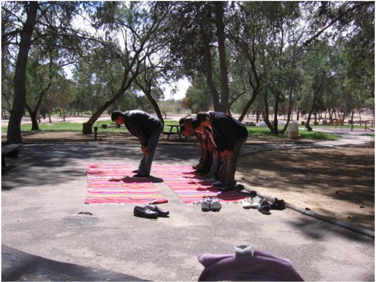
מתפללים ומודים לאללה על כל הטוב שנתן להם